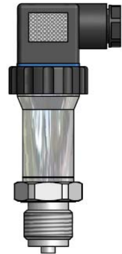
壓力傳感器 Type PT502